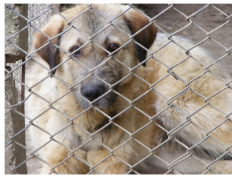
Jamie, wachtend op een nieuw baasje.