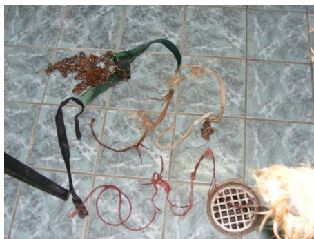
Dit is het resultaat.